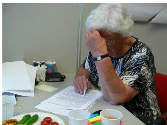
Coderen door leden van de werkgroep.